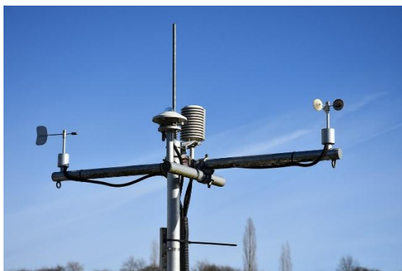
Gambar 2. Sistem stasiun cuaca berbasis IoT

Penelitian ini bertujuan untuk merancang dan mengimplementasikan sebuah sistem stasiun cuaca berbasis Internet of Things (IoT) seperti terlihat pada Gambar 2 yang dapat memberikan solusi pemantauan lingkungan pertanian secara real-time .