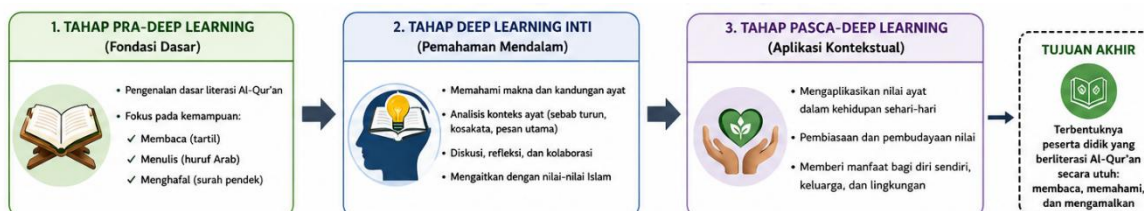
Gambar 2. Tahapan Pembinaan Literasi Al-Quran Berbasis Deep Learning di MIS Nurul Ilmi Kota Bima

Pendapat lain juga mengatakan bahwa pola pembinaan literasi Al-Qur'an menuntut adanya tahapan yang terstruktur, mulai dari penguatan kemampuan membaca, pemahaman kosakata, analisis makna ayat, hingga internalisasi nilai (Suyitno, 2017b). Penjelasan di atas menunjukkan bahwa ketika siswa terbiasa membaca, mereka akan termotivasi dan menjadikan kegiatan tersebut sebagai sesuatu yang harus diingat untuk dilakukan. Di sisi lain, siswa juga memperoleh pengetahuan baru. Kegiatan membaca dapat menjadi kebiasaan di madrasah jika dilakukan secara terus-menerus, baik di dalam kelas maupun di luar kelas dan lingkungan sosial. Membentuk kebiasaan siswa membutuhkan waktu yang relatif lama, oleh karena itu dibutuhkan kesabaran dan kerja sama dari guru di sekolah (Heremansyah, 2022).