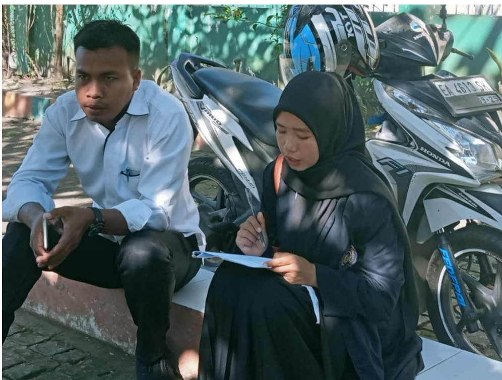
Gambar 4. Wawancara guru mata pelajaran tahfidz kegiatan.

Sesuai dengan penelitian yang dilakukan oleh Al-Qoyyim & Nabila (2025) mengatakan bahwa implementasi Deep Learning dalam pembelajaran memerlukan strategi yang tepat agar peserta didik mampu membangun pemahaman secara aktif dan bermakna. Oleh karena itu, para guru harus benar benar pro aktif dalam merencanakan, mengimplementasikan, dan mengevaluasi kegiatan pembelajarannya, karena keberhasilan pembelajaran sangat dipengaruhi oleh setiap proses atau tahapan dala, pembelajaran tersebut.