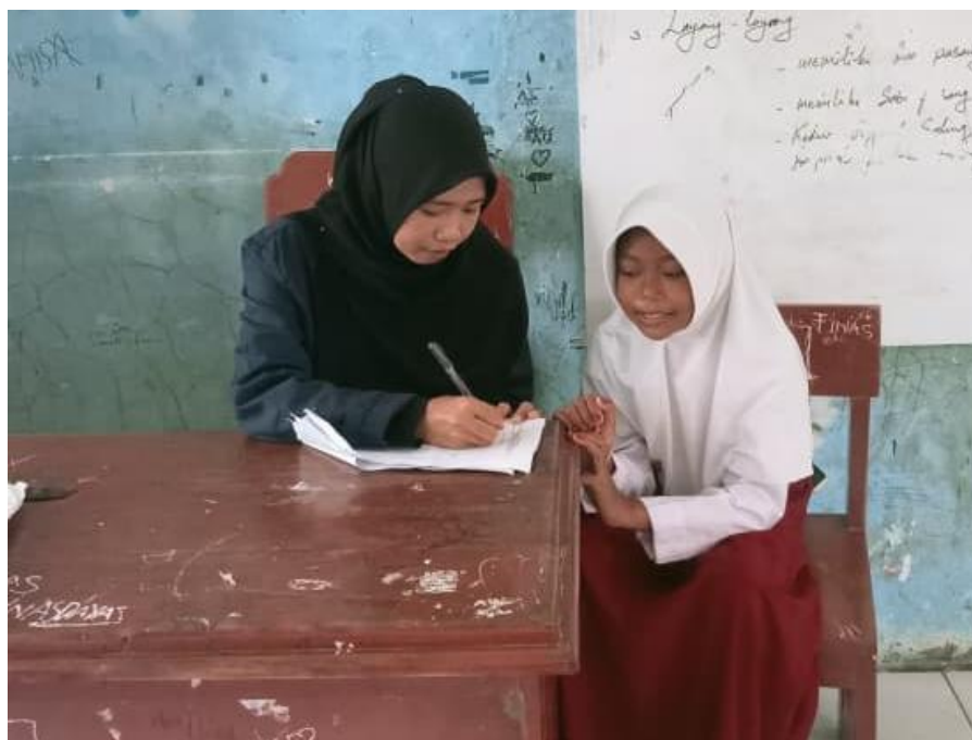
Gambar 4. Wawancara siswa

Selain itu, adapun faktor pendukung dalam pola pembinaan literasi Al-Qur'an berbasis Deep Learning di Mis Nurul Ilmi Kota Bima yaitu dimana selain penghambat di Mis Nurul Ilmi Kota Bima ini berusaha untuk memberikan yang terbaik dalam pola pembinaan literasi Al-Qur'an berbasis Deep Learning yang dimana baik pihak sekolah maupun guru berusaha mengaitkan antara bacaan yang di baca dan kebiasaan siswa sehari hari yang di antaranya