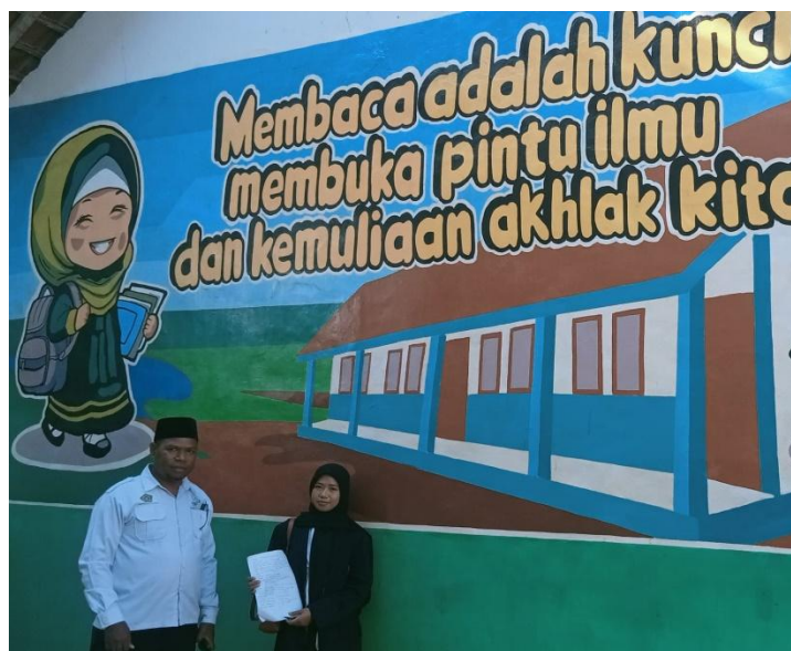
Gambar 1. Wawancara kepala sekolah

aplikasi kontekstual, setelah memahami makna kandungan Al-Qur'an yang dibaca diupayakan agar dapat merealisasikan dalam kehidupan sehari-hari terkait dengan apa yang dibaca dan dimaknai agar apa yang telah dipelajari dapat bermanfaat bagi diri sendiri dan orang lain.