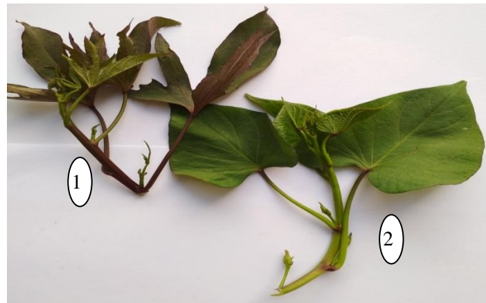
Gambar 3. Klon tanaman ubi jalar madu (1) dan klon tanaman ubi jalar merah(2)

Hal yang paling penting diperhatikan dalam pembuatan guludan adalah ukuran tinggi tidak melebihi 40 cm. Guludan yang terlalu tinggi cenderung menyebabkan terbentuknya umbi berukuran panjang dan dalam sehingga menyulitkan pada saat panen. Sebaliknya, guludan yang terlalu dangkal dapat menyebabkan terganggunya pertumbuhan atau perkembangan umbi, dan memudahkan serangan hama boleng atau lanas oleh Cylas sp (Setyawan, 2015). Hasil penelitian ini juga menunjukkan bahwa tinggi bedengan 40 cm menunjukkan hasil terbaik terhadap semua variabel yang diamati (Tabel 3). Berbeda dengan hasil penelitian (Murda & Soelistyono, 2019) yang melakukan penelitian pada tanaman terung ungu tinggi bedengan 20 cm menunjukkan nilai pertumbuhan dan hasil terung ungu yang lebih baik pada hampir seluruh parameter.