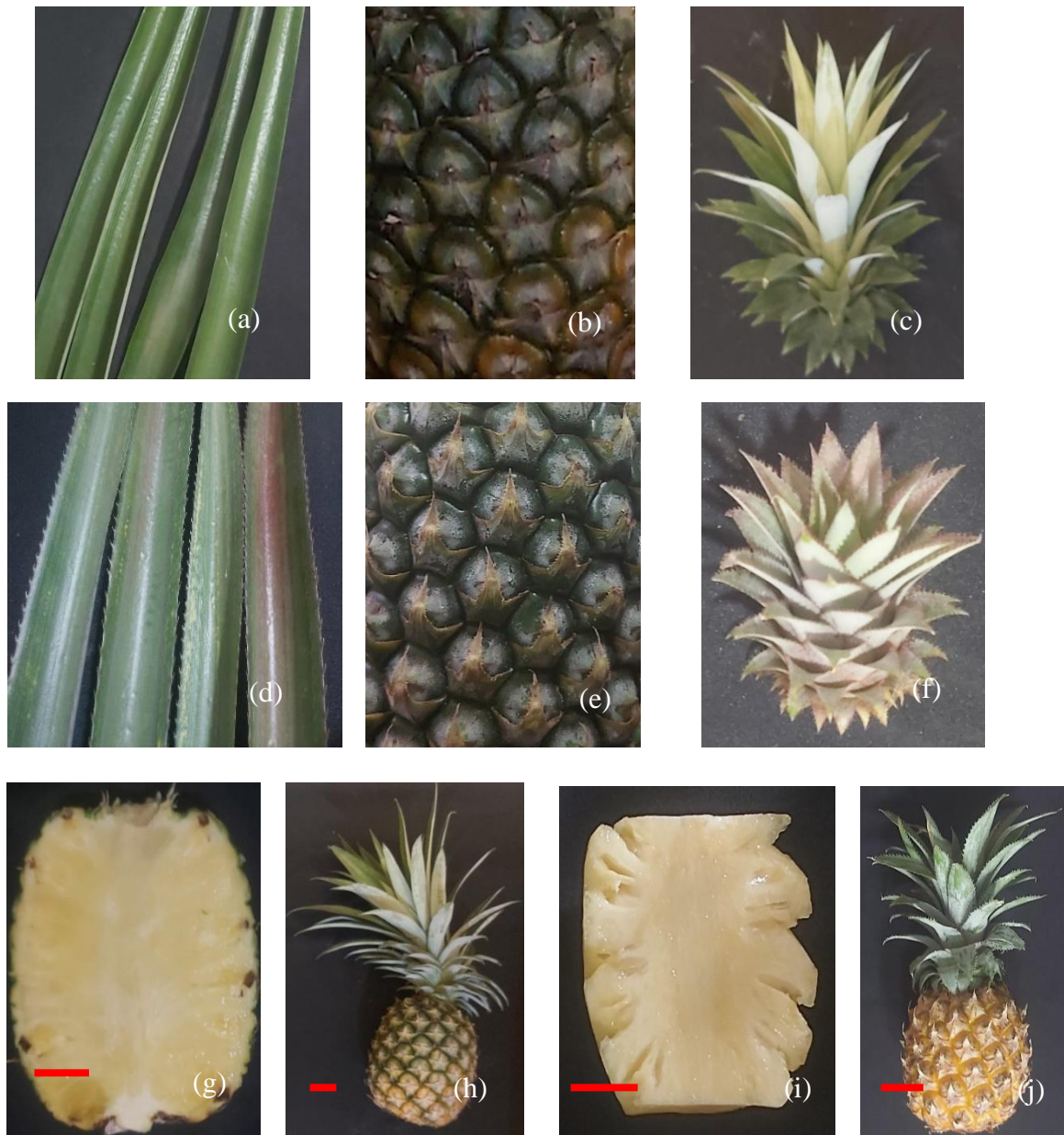
Gambar 2. Karakter kualitatif nanas

Keterangan: 1. Varietas Cayenne: (a) warna daun dan kondisi duri, (b) kondisi mata, (c) kondisi mahkota, (g) warna daging buah (red line=0,31cm), (h) bentuk buah (red line=0,15cm); 2. Varietas Queen: (d) warna daun dan kondisi duri, (e) kondisi mata, (f) kondisi mahkota, (i) warna daging buah (red line=0,38cm), (j) bentuk buah (red line=0,24cm). (Dokumentasi Pribadi)